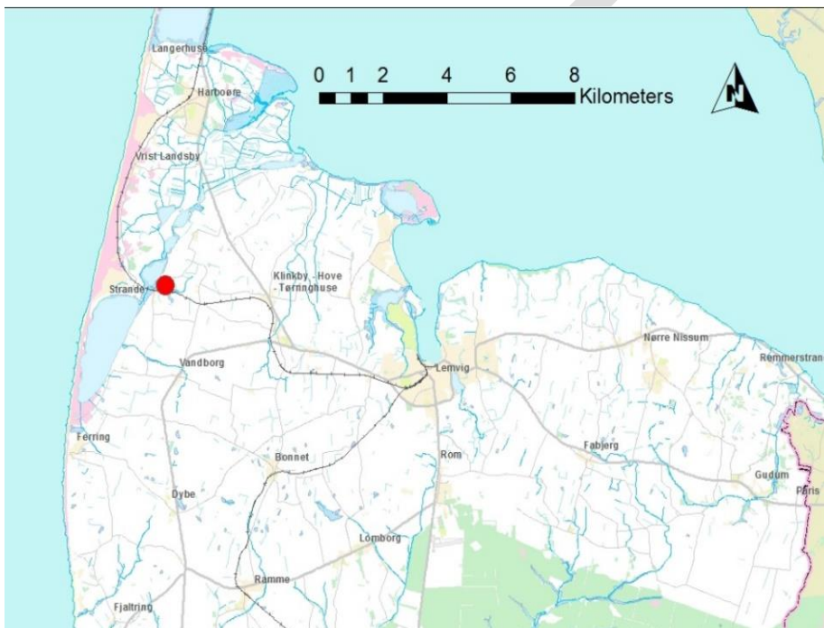
Figur 1: Projektområdet Strande Enge markeret med rød prik vest for Lemvig.

Lemvig kommune ønsker at etablere et vådområde på 19,8 ha øst for Søndervese, illustreret i figur 1 og 2. Projektområdet ses indtegnet med rød streg på figur 2.